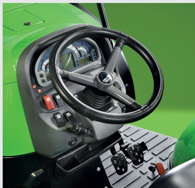
↑ Ρυθμιζόμενη κολώνα τιμονιού και ψηφιακό ταμπλό.