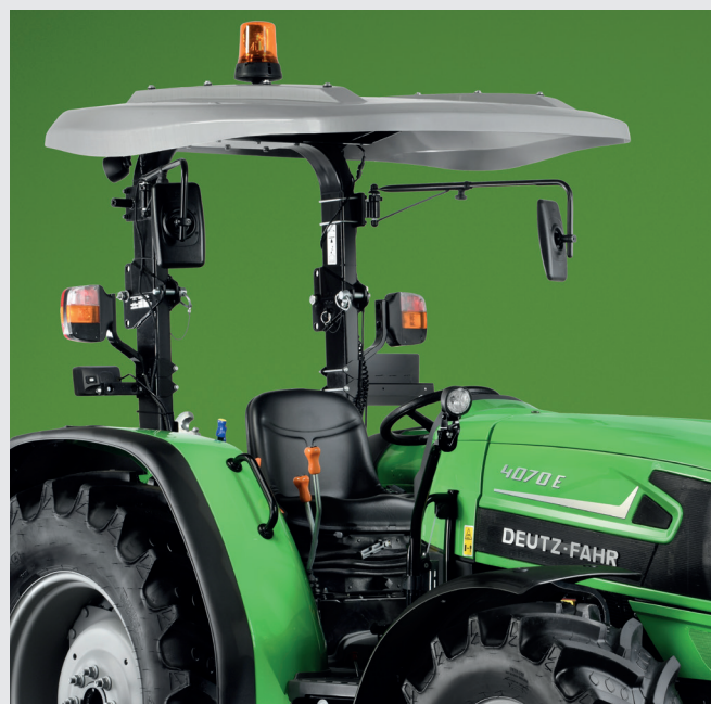
↑ Κουβούκλιο ηλιοροφής (επίσης διαθέσιμο με FOPS).